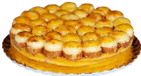
Tarta de Pionono

Tarta de Oreo Gourmet troceada en 14 porciones