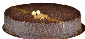
Tarta de Ferrero

Tarta de Dulce de Leche troceada en 14 porciones