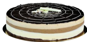
Tarta Cinco Chocolates