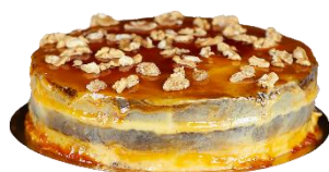
Tarta de Crema Catalana y Brownie

Tarta Cinco Chocolates troceada en 14 porciones