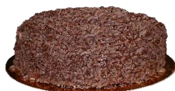
Tarta Muerte por Chocolate

Tarta de Kit Kat troceada en 14 porciones