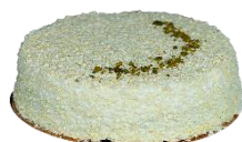
Tarta Muerte por Chocolate Blanco

Tarta Muerte por chocolate troceada en 14 porciones