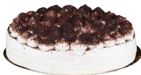
Tarta de Tiramisú