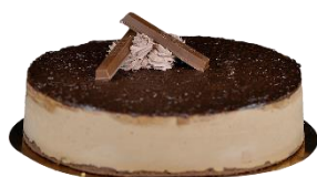
Tarta de Kit Kat

Tarta Kinder Bueno troceada en 14 porciones