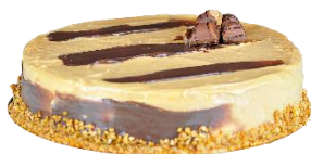
Tarta Kinder Bueno