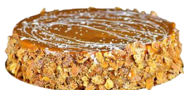
Tarta de Dulce de Leche

Tarta de Crema Catalana y Brownie troceada en 14 porciones