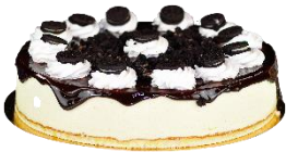
Tarta Oreo Gourmet